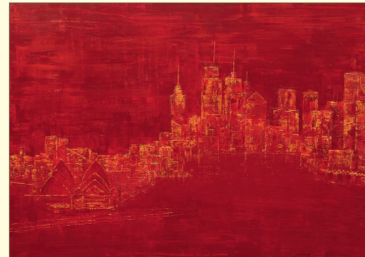
Sydney | Acryl, div. Mischtechniken auf grundierter Leinwand | 145 x 105 cm

Seit 2005 lebt sie in Berlin und arbeitet, bzw. studiert an verschiedenen Berliner Institutionen, wie z. B. der Freien Akademie für Kunst, der Akademie für Malerei und der Freien Universität Berlin.