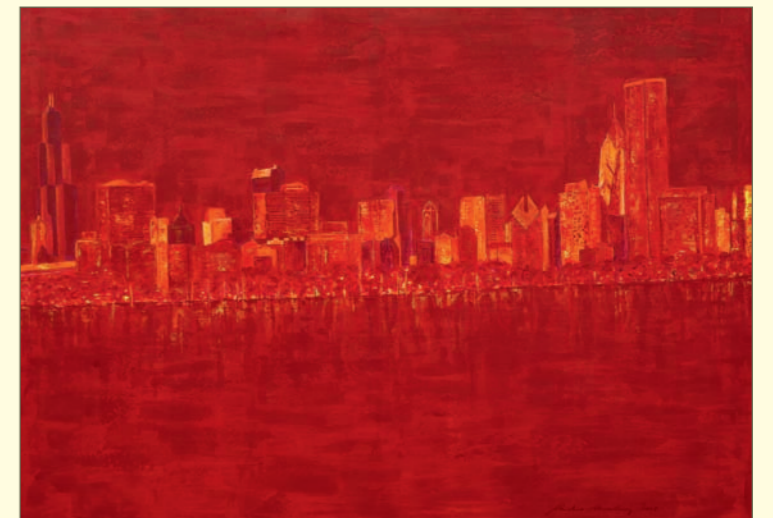
Chicago | div. Mischtechniken auf grundierter Leinwand | 145 x 105 cm