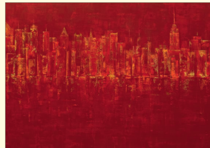
New York and Hudson River | div. Mischtechniken auf grundierter Leinwand | 145 x 105 cm