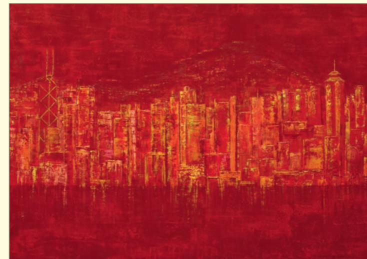
Hongkong | div. Mischtechniken auf grundierter Leinwand | 145 x 105 cm