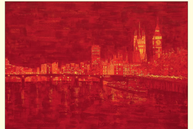
London | Acryl, div. Mischtechniken auf grundierter Leinwand | 145 x 105 cm